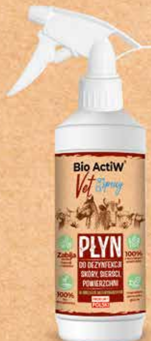
produkt gotowy do użycia

Podmiot odpowiedzialny: BIO ACTIW sp. z o.o. www.bioactiw.pl