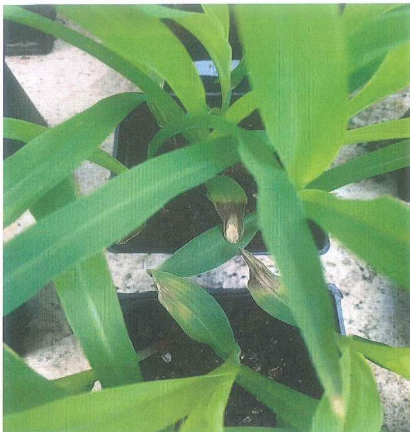
Fot.3 Obiekt 2 kontrola pozytywna/ Object 2 positive untreated