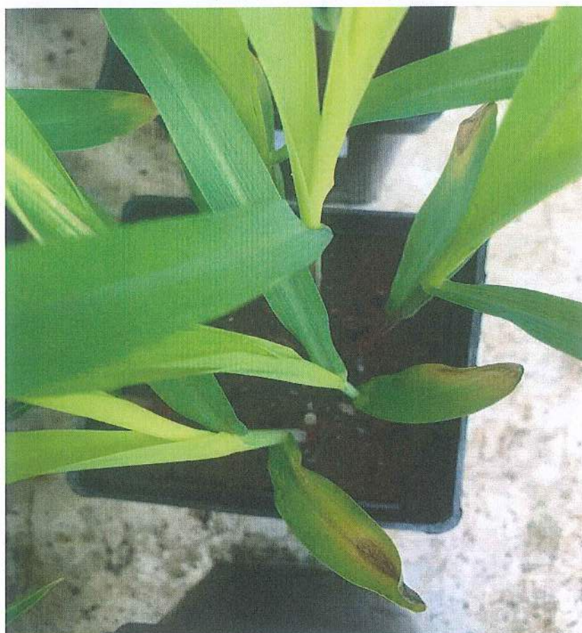
Fot.4 Obiekt 2 kontrola pozytywna/ Object 2 positive untreated